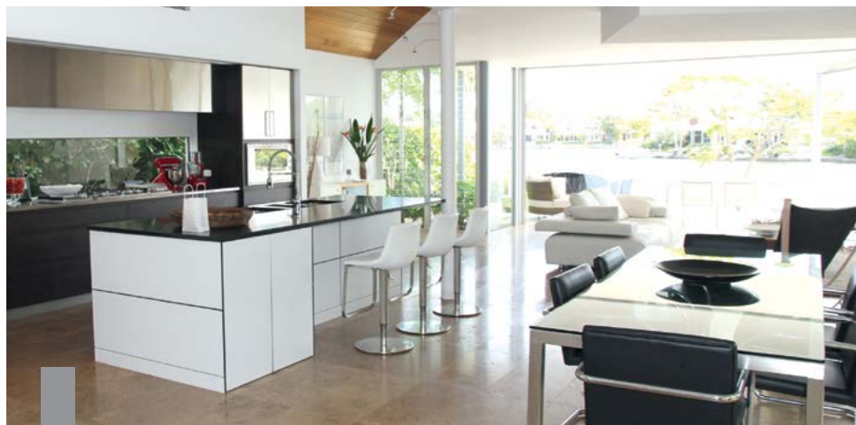
Die Vermietung möblierter Wohnungen hat Vorteile für Mieter und Vermieter.

Die Vermietung möblierter oder teilmöblierter Wohnungen wird immer beliebter, zum Beispiel, um den Umzug für alte und neue Mieter zu vereinfachen oder weil das Angebot dem Trend zum temporären Wohnen folgt. Vermieter sollten sich aber genau erkundigen, welchen Aufschlag sie für die Möblierung berechnen, wenn sie steuerliche Vorteile erzielen wollen. In einem Fall vor dem Bundesfinanzhof (BFH, Az. IX R 14/17) hatten Eltern ihrem Sohn eine teilmöblierte Wohnung vermietet. Darin befanden sich eine neue Einbauküche, eine Waschmaschine und ein Trockner. In ihrer Steuererklärung machten sie Einkünfte aus Vermietung und Verpachtung geltend. Sie unterließen es, für die vermieteten Geräte die ortsübliche Vergleichsmiete gesondert anzugeben, berücksichtigten die überlassenen Gegenstände jedoch nach dem Punktesystem des Mietspiegels. Das Finanzamt erkannte die Werbungskostenüberschüsse nicht in voller Höhe an, weil es von einer verbilligten Vermietung der Wohnung ausging. Laut BFH ist bei der Überlassung von Möbeln immer auch ein Möblierungszuschlag anzusetzen.